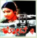
೯.೦೩.೨೦೧೭ರ ಅವಾರಾತ್ನ ೩.೦೦ ರಿಂದ ೪.೦೦ ರಾ.ಮಿ.ನವರಸಂದಮಯ್ಯ ಕಟ್ಟಡ