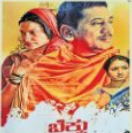
೯.೦೩.೨೦೧೭ರ ಮುಂಬಾತ್ ೯.೩೦ ರಿಂದ ೧೧.೦೦ ರಾ.ಮಿ.ನವರಸಂದಮಯ್ಯ ಕಟ್ಟಡ